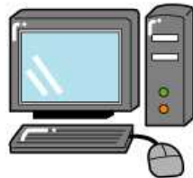
パソコン ノート型含む