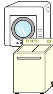
衣類乾燥機 洗濯機