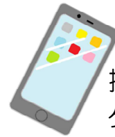
携帯電話、スマホ タブレット端末