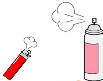
ライター スプレー・ガス缶類