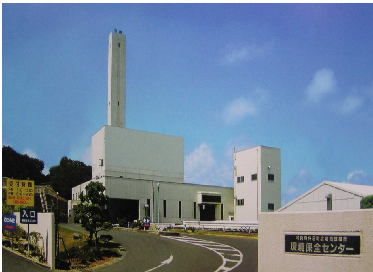
環境保全センター入口より